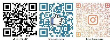
メルマガ Facebook Instagram

館内情報やトレーニングなどを、メルマガやSNSにて配信しています。QRコードから登録し、お得な情報をゲットしよう★