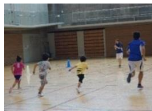
走り方教室 動きづくり教室