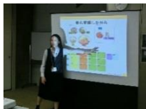
管理栄養士による 栄養講話

専門スタッフによる講話や実技など、さまざまな内容の無料プチセミナー“ISC 教養講座”や発育発達の著しいお子様を対象にした“ISC こども運動教室”を行う予定です。日程など詳細については、決まり次第、お知らせします。お楽しみに！