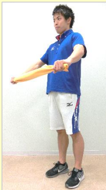
①タオルをおへその高さでキープする