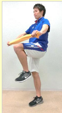
②片脚ずつ膝を交互に持ち上げる