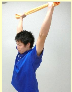
①タオルの両端を持つ

丸まりやすい 背中 の筋肉を使います。姿勢を正すことで、呼吸も深くなり、見た目も若々しくなります。