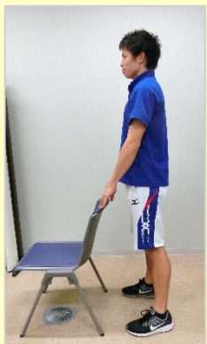
①椅子やテーブルにつかまる