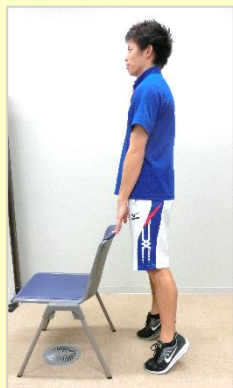
③膝を伸ばし踵を持ち上げる